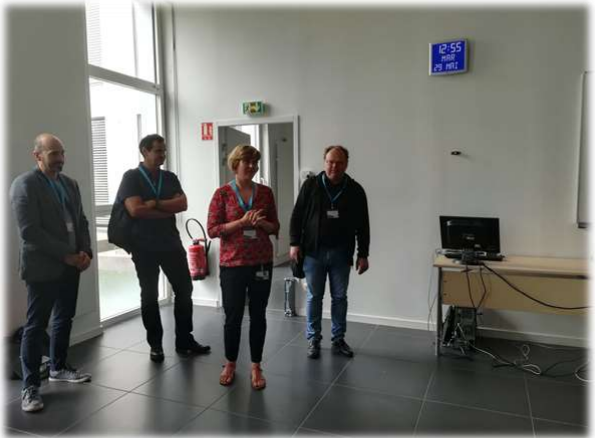
Conclusion des Journées par Organisateurs et Membres de la Commission Matériaux pour la Santé